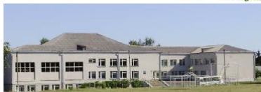
НБК «ЗНЗ-ДНЗ» с. Лучинець