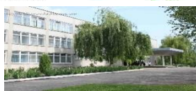
НБК «СЗШ №1-гімназія» смт. Муровані Курилівці